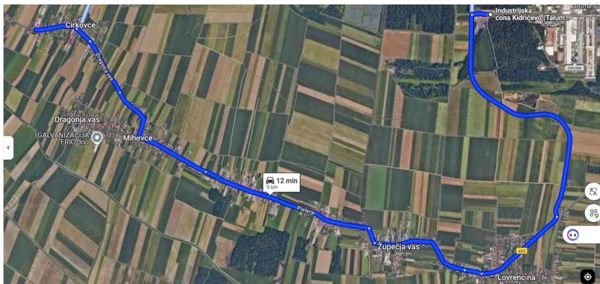
Print screen Google zemljevida

Trasa: OŠ Cirkovce – krožišče v industrijski coni Talum Kidričevo – OŠ Cirkovce = 18 km